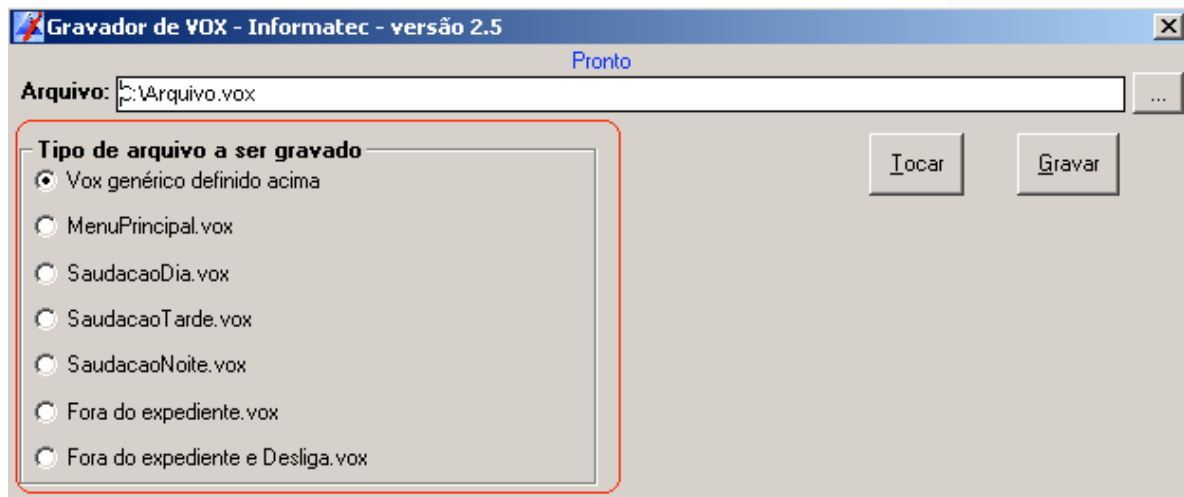
Janela do programa "Convertor de VOX Informatec"

Após escolher umas das opções clique em "Gravar".