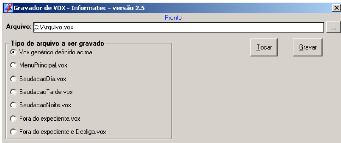
Janela do programa "Conversor de VOX Informatec"

Para parar de gravar aperte qualquer digito MF (Multi-Freqüencial) do seu aparelho telefônico.