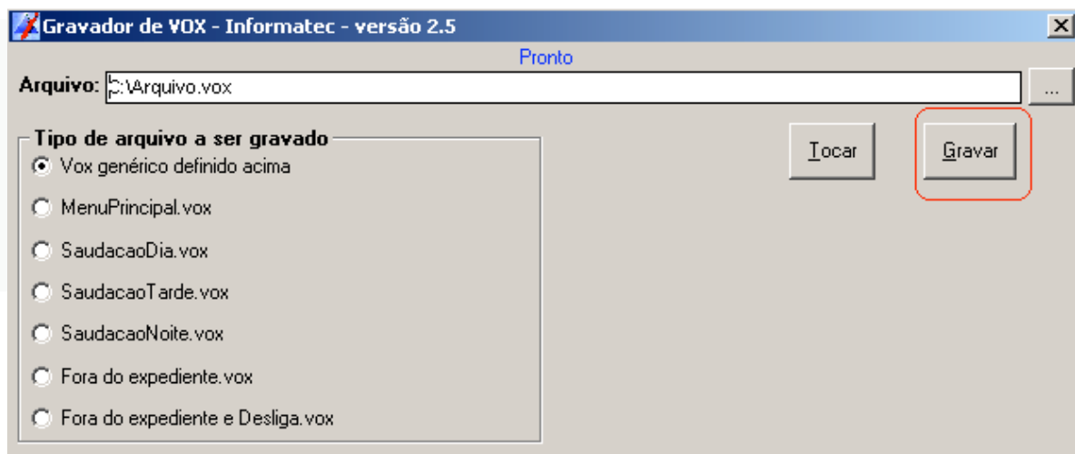
Janela do programa "Convertor de VOX Informatec"

Após escolher umas das opções clique em "Gravar".